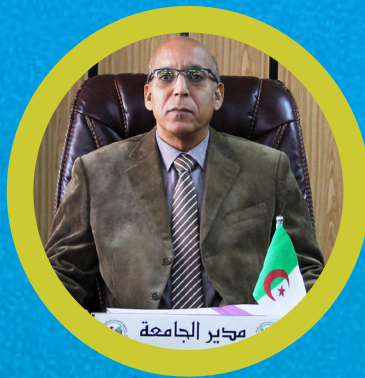
PR. HALILAT MOHAMMED TAHAR RECTEUR DE L'UNIVERSITÉ KASDI-MERBAH OUARGLA